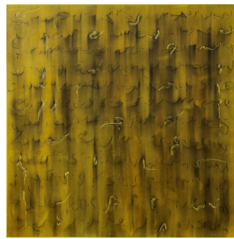
20.22 Word ( Mot )

« Ayant ainsi parlé, il souffla sur eux et il leur dit : “Recevez l’Esprit Saint.” » Jn 20,22