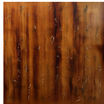
1.51 Earth (Terre)

« Amen, amen, je vous le dis : vous verrez le ciel ouvert, et les anges de Dieu monter et descendre au-dessus du Fils de l'homme. » Jn 1,51