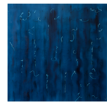
21.6 Fishing (Pêche)

« Il leur dit : "Jetez le filet à droite de la barque, et vous trouverez." Ils jetèrent donc le filet, et cette fois ils n'arrivaient pas à le tirer, tellement il y avait de poissons. » Jn 21,6