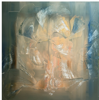
1.51 Angel (Ange)

Les écritures vertes de 14.2 Hope évoquent une promesse encore invisible, la parole déposée dans le cœur comme une attente confiante. 14.2 Home ouvre un espace vers la lumière, comme une demeure déjà préparée, où l'âme est appelée à entrer. Ce diptyque invite à croire que l'espérance n'est pas un rêve lointain.