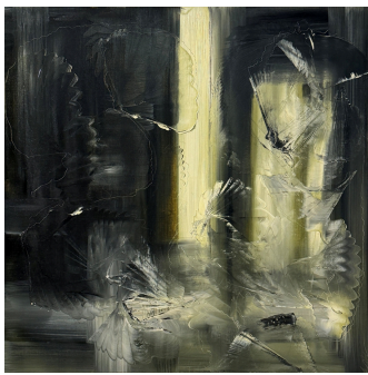
20.22 Breath ( Souffle )