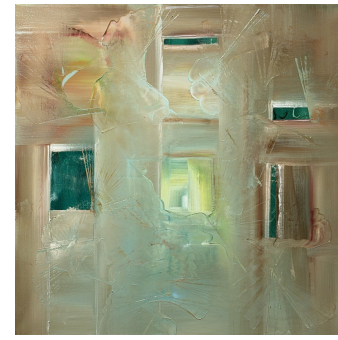
14.2 Home (Maison)