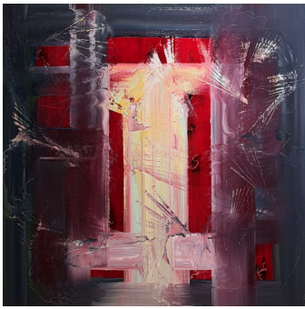
3.16 Salvation (Salut)