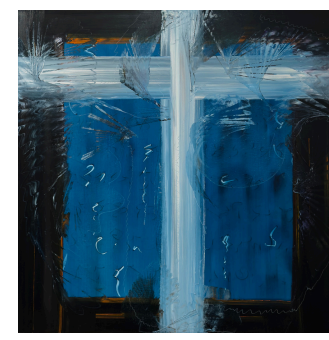
21.6 Miracle (Miracle)

Le diptyque 1.51 offre la promesse d'un ciel ouvert. 1.51 Earth fait écho à la condition humaine, marquée par la matière et l'attente, tandis que 1.51 Angel révèle le mouvement de Dieu qui descend vers l'homme pour l'élever vers Lui.