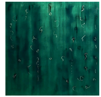
14.2 Hope (Espoir)

« Car Dieu a tellement aimé le monde qu'il a donné son Fils unique, afin que quiconque croit en lui ne se perde pas, mais obtienne la vie éternelle. » Jn 3,16